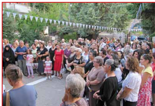
22-8-2012. Έσπερινός αποδόσεως τής εορτής Κοιμήσεως τής Θεοτόκου στήν Ἱ. Μονή Παναγίας Μακρυρράχης.