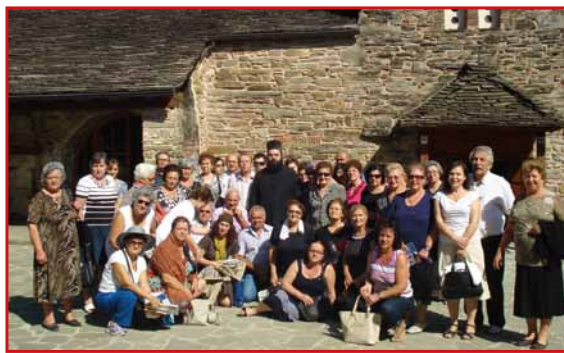
4-9-2012. Ένοριακό προσκύνημα στήν Ἱ. Μονή Παναγίας Μολυβδοσκεπάστης στήν Κόνιτσα.