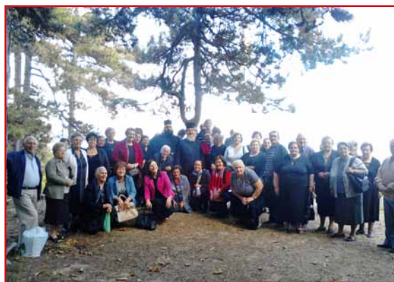
9-10-2012. Ένοριακό προσκύνημα στό Σταυρό τοῦ Ἁγίου Κοσμά τοῦ Αἰτωλοῦ, στήν Ἄνω Μηλιά Πιερίας.