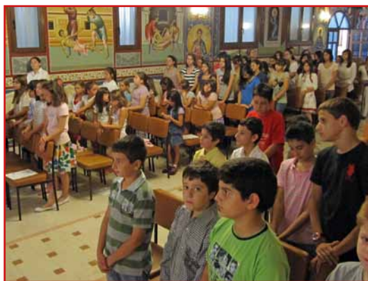
6-10-2012. Άγιασμός ἔναρξης παιδικῶν καί νεανικῶν συνάξεων τής ἐνορίας μας.