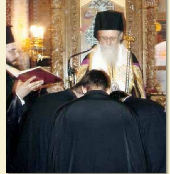
Χειροθεσία τριῶν νέων ἀναγνωστών στήν ἐνορία μας.