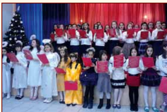
Τά κορίτσια τοῦ Δημοτικοῦ στήν Χριστουγεννιάτικη γιορτή τῆς ἐνορίας μας.