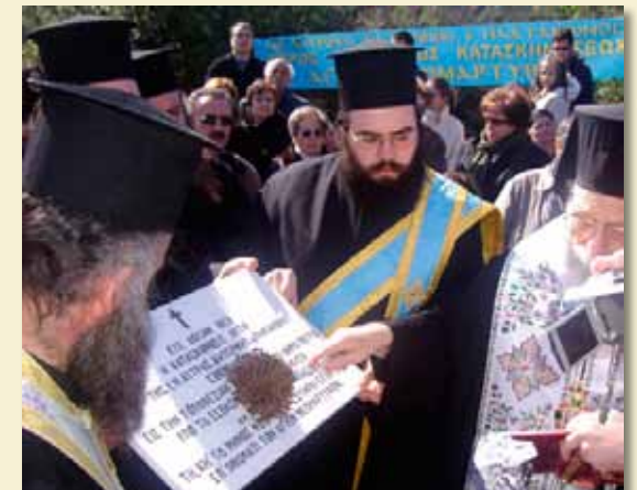
Θεμελίωση Κατασκηνώσεως τῆς Ἱ. Μητροπόλεως.