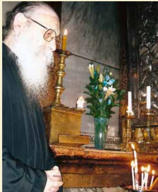
Στόν Πανάγιο Τάφο.

Δέν ἔλειπαν ποτέ ἀπό τή σκέψη του οἱ πάσχοντες ἀδελφοί μας. Ἀφουγκραζόταν τόν πόνο τους καί προσπαθοῦσε μέ κάθε τρόπο νά ἀνακουφίσει τίς ἀνάγκες τους. Γι' αὐτό τό λόγο ἰδιαίτερα μερίμνησε γιά τή λειτουργία: Τοῦ Γενικοῦ Φιλοπτώχου Ταμείου τῆς Ἱερᾶς Μητροπόλεως καί πολλῶν Ἐνοριακῶν. Τοῦ Ἐκκλησιαστικοῦ μας