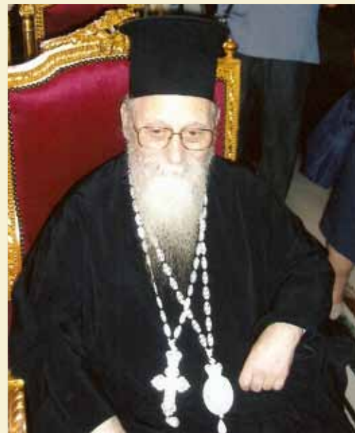
Στό Πατριαρχεῖο Ἱεροσολύμων.

Ἐπέβλεπε προσωπικά τήν πορεία τῶν ἐργασιῶν στοὺς Ἱ. Ναοὺς καί τίς Ἱ. Μονές τῆς Ἱ. Μητροπόλεως. Ἦθελε οἱ Ναοί νά εἶναι καλλωπισμένοι καί οἱ χώροι λειτουργικοί. Ἐγκαινίασε 40 νέους Ἱερούς Ναοὺς. Ἐπίσης φρόντισε ἰδιαίτερα γιά τήν ἐπανάδρωση τῶν Ἱ. Μονῶν καί χαίροταν γιά τήν αὔξηση τῶν ἀδελφοτήτων καί τήν πρόοδο τῶν μοναχῶν. Ἐπί τῶν ἡμερῶν τοῦ ἐπαναλειτούργησαν οἱ γυναικεῖες Ἱ. Μονές Ἁγ. Ἀθανασίου Κολινδρού καί Παναγίας Μακρυννάχης Παλαιόστανης, ἐνῶ ἐπανδρώθηκε ἡ ἀνδρῶα Ἱ. Μονή Ἁγ. Διονυσίου τοῦ ἐν Ὀλύμπῳ.