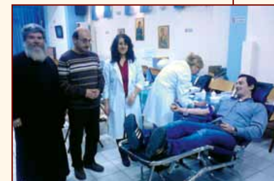
Πρώτη ἐθελοντική αἰμοδοσία στήν ἐνορία μας (15.12.2013).