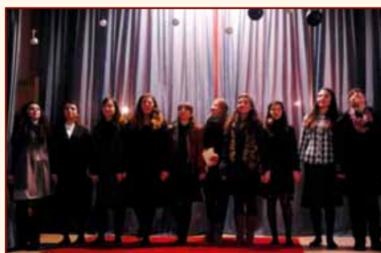
Ἡ θεατρική ομάδα τῆς ἐνορίας μας στήν Χριστουγεννιάτικη γιορτή.

Άπο τίς Πανηγυρικές ἐκδηλώσεις τῆς ἐνορίας μας «ΘΕΟΠΡΟΜΗΤΟΡΙΚΑ 2013» μέ τήν παρουσία τοῦ Σεβ. Μητροπολίτου Λαρίσης καί Τυρνάβου κ. Ἰγνατίου, Τοποτηρητοῦ τῆς Ἱ. Μητροπόλεώς μας.