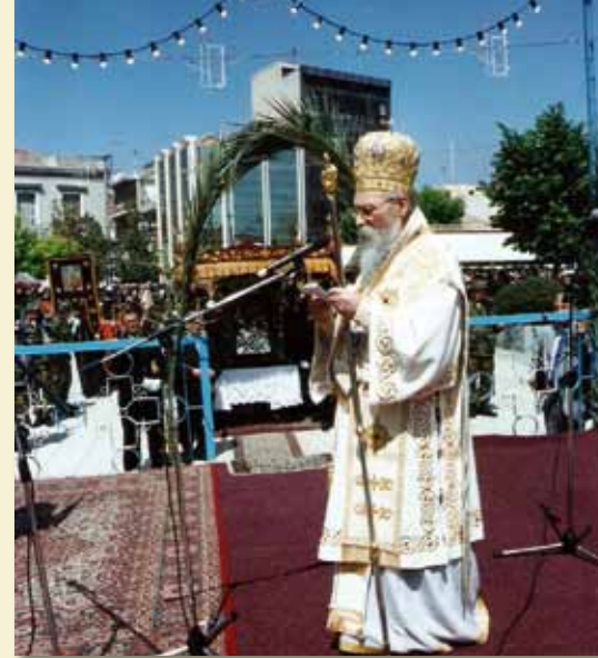
Στήν πλατεῖα τοῦ Αἰγίου.