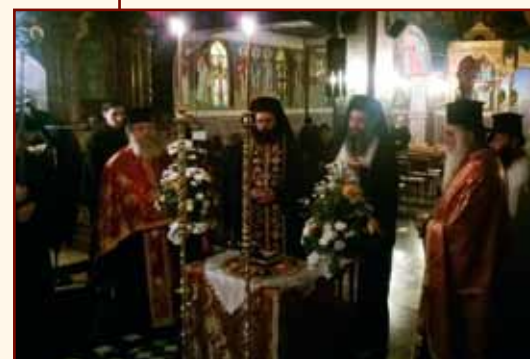
Ἐποδοχή ἱερῶν λειψάνων Ἁγίων Πέντε Μαρτύρων (12.12.2013).