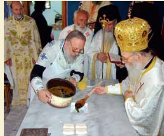
Ἐγκαινιασμός νέου Ἱεροῦ Ναοῦ.