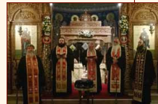
Μυστήριο ἱεροῦ εὐχελαίου (10.12.2013).