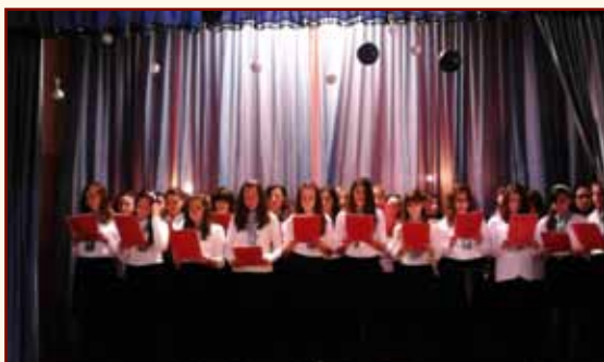
Τά κορίτσια τοῦ Γυμνασίου στήν Χριστουγεννιάτικη γιορτή τῆς ἐνορίας μας.