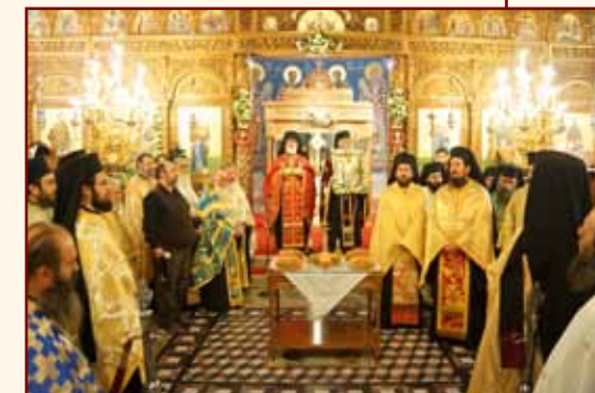
Ἀκολουθία τῆς ἀρτοκλασίας (8.12.2013).