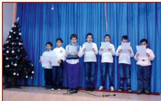
Ἀγόρια τοῦ Δημοτικοῦ στήν Χριστουγεννιάτικη γιορτή τῆς ἐνορίας μας.