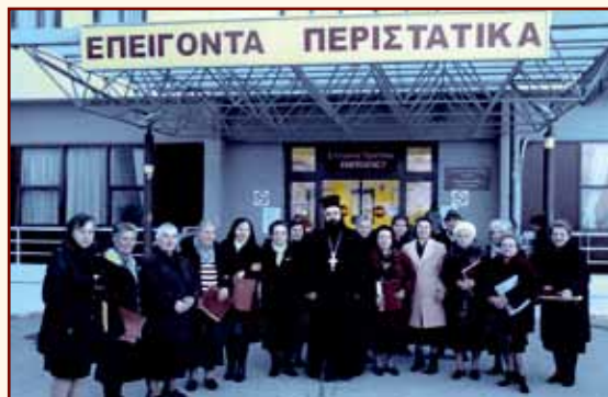
Άπο τήν ἐπίσκεψη τῆς γυναικείας χορωδίας τῆς ἐνορίας μας στό Νοσοκομεῖο τῆς Κατερίνης, ὅπου ἔψαλλαν τά Κάλαντα στούς ἀσθενεῖς (23-12-2013).