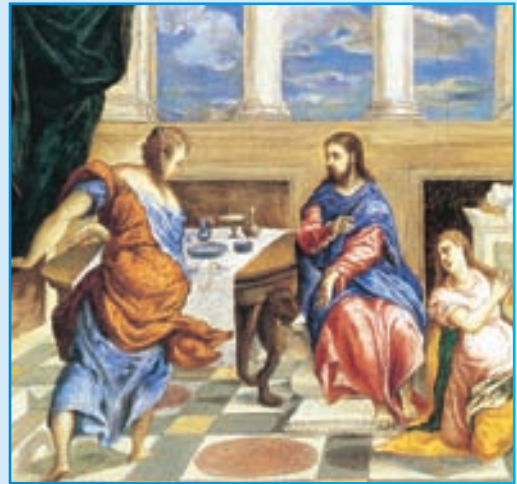
Ὁ Χριστός στό σπίτι τῶν Μάρθας καί Μαρίας. Ζωγραφικός πίνακας τοῦ El Greco.

λόγο τοῦ Θεοῦ. Μιά γυναίκα, πού ἄκουγε τό Χριστό νά διδάσκει, τόσο ἐνθουσιάστηκε ἀπ' τή θεῖα διδασκαλία του, ὥστε δέν κρατήθηκε, ἀλλά φώναξε δυνατά·