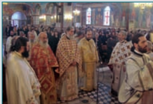
9.12.2010. Θεία Λειτουργία ἀνήμερα τῆς ἐορτῆς.

Ἰδιαίτερη ἦταν καί ἡ εὐλογία πού εἶχαμε ἀπὸ τὴν παρουσία Ἱερῶν Λειτουργῶν ἀπὸ διάφορες ἐνορίες τῆς Ἱ. Μητροπόλεώς μας. Ὑποδεχθήκαμε τὰ ἐξῆς Ἱερά Λείψανα: Ἁγίου Ἀνδρέου τοῦ Πρωτοκλήτου, Ἁγίου Μεγαλομάρτυρος Παντελεήμονος, Ἁγίου Μάρτυρος Τρύφωνος, Ἁγίων Νηπίων καί Ἁγίου Νείλου τοῦ Μυροβλύτου.