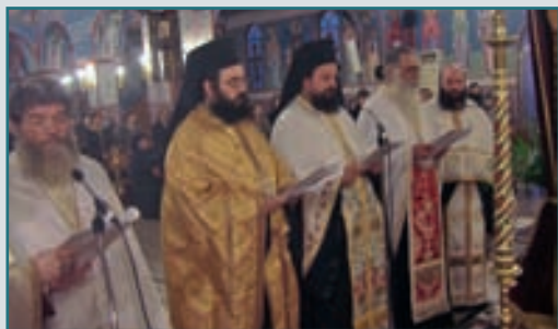
7.12.2010. Ἐγκώμια Ἁγίας Θεοπρομήτορος Ἄννης.